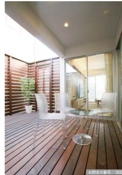
お問合せ番号 / 000