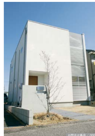
お問合せ番号 / 000

2階からも光が届く 2階のトップライトからの光が、透過性のある床を通して1階に届き、家中が明るい