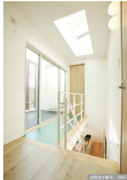
お問合せ番号 / 000

プライバシーに配慮されたセンターコートのウッドデッキは、外と中を繋ぐもう一つのリビングルーム