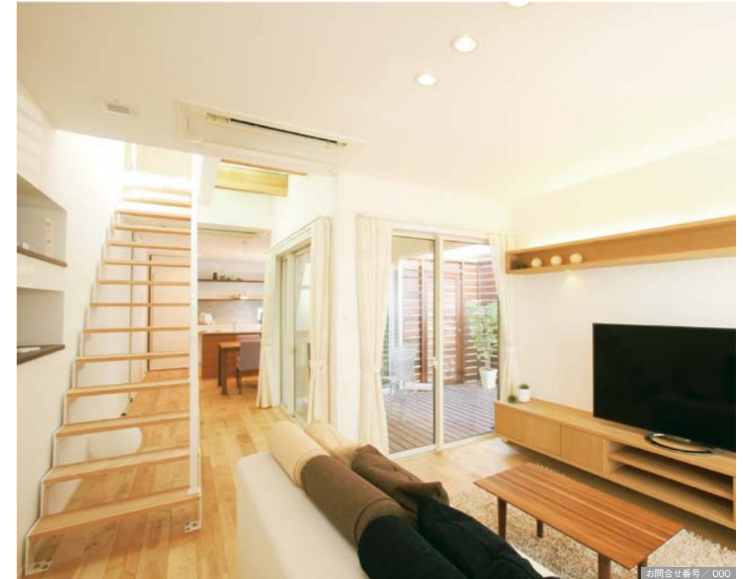
お問合せ番号 / 000

近隣の視線を気にしなくて済むウッドデッキを、室内の中心に配置したLDK。一日中気持ちのいい光や風を室内に取り込むことができる心地よい空間。ウッドデッキを中心に、リビング・ダイニングが緩やかにゾーニングされているので、家族が思い思いの場所で過ごすのも、一ヶ所に集まって過ごすのも楽しい。