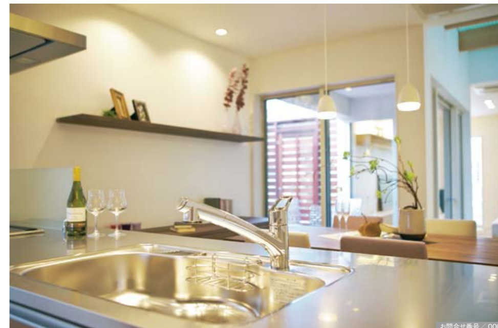
お問合せ番号 / 000

様々な方向から射し込む太陽の光が、朝からキッチンを明るく照らして、希望に溢れた新しい一日を教えてくれる。吊り棚がないのですっきりと開放的で手元が明るい。チタン研磨のワークトップはお手入れが楽で料理もはかどる。